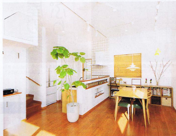
天井の高さは3.1m。しっかりと高さを確保することで、実際以上に広く感じさせてくれるダイニング。階段横の壁面上部には、プロジェクターを収納するスペースを造作した