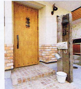
1階下半分にアンティークレンガをあしらった古い枕木がアクセント

問い合わせ先 Free 0800-814-6810 ※IP電話など、一部の電話からは繋がらない場合があります(携帯電話は可)