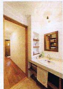
日当たりのいい2階をリビングに充て、水回りは1階に集約。使い勝手も抜群の間取りに