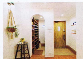
アールの入口が可愛い玄関スペース。家族用と来客用の2WAYで、いつもすっきり