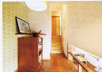
2階と3階の間に籠り感が楽しいスキップフロアを設けた。子どもたちの遊び場にも最適だ