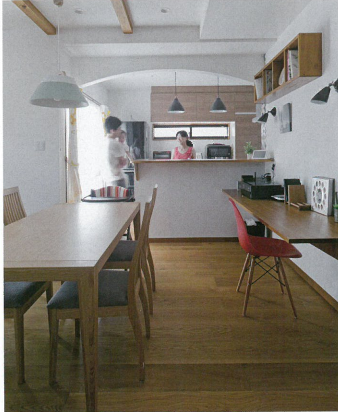
ウッドデッキから光が降り注ぐダイニング。ランドリースペースと隣接しており、料理をしながらの洗濯など、効率的に家事ができる。造作デスクや壁づけの収納棚など、すべて無垢材だ