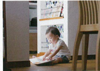
キッチンカウンターにはマガジンラックを造作。背面に貼られたタイルがアクセント