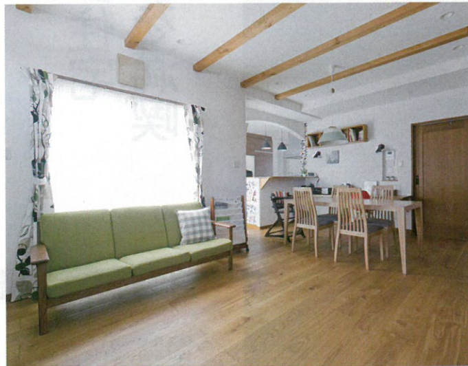
床暖房対応のオーク無垢材は足触り抜群。パーフェクトウォールの塗り壁が調湿効果を発揮し、夏も涼しかったそう。「自然素材はハウスアップさんの提案。想像以上に快適でびっくり」