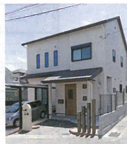
何度も間取りを描いてもらいながら打ち合わせを重ね、完成した