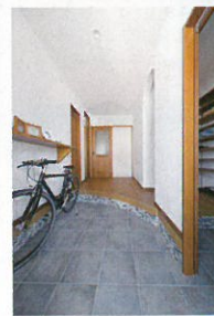
自転車も置ける広い玄関。シューズクロゼットのある家族用と、来客用の2Wayに