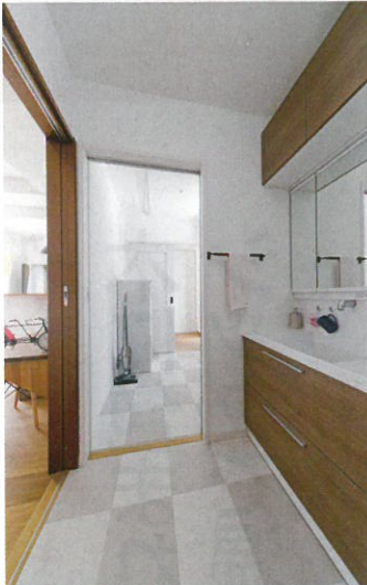
浴室から洗面脱衣室、ランドリースペースへとつづく。リビングからも回遊できる間取り