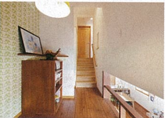
2階と3階の間に籠り感が楽しいスキップフロアを設けた。子どもたちの遊び場にも最適だ