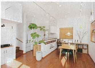
天井の高さは3.1m。しっかりと高さを確保することで、実際以上に広く感じさせてくれる