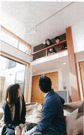
スキップフロアからはLDKが見下ろせる。どこにいても家族がつながる感覚が嬉しい