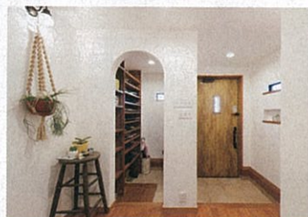
アールの入口が可愛らしい玄関スペース。家族用と来客用の2WAYで、いつもすっきり